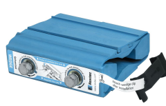
Wedge y Wedgekit